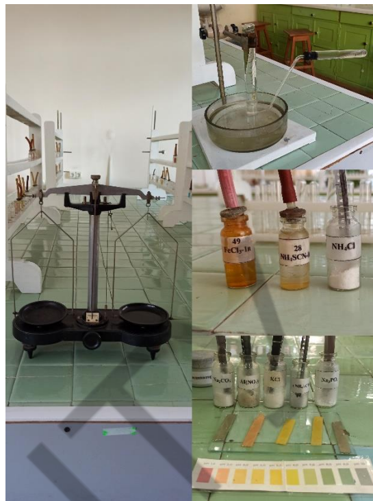
Рис. 2 – Приклади устаткування та дослідних зразків

Слід відзначити такі особливості запропонованого підходу: