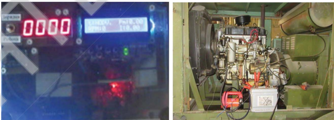
Fig. 2. Appearance of the microprocessor's electromechanical lubrication system.

For the practical implementation and experimental verification of the ability to provide the optimal lubrication mode in the internal combustion engine, the authors developed and programmed an electromechanical microprocessor lubrication system (EMLS) according to the above mathematical model. The appearance and position of the electric pump and the sensors on the power plant with a combustion engine are shown in Figure 2.