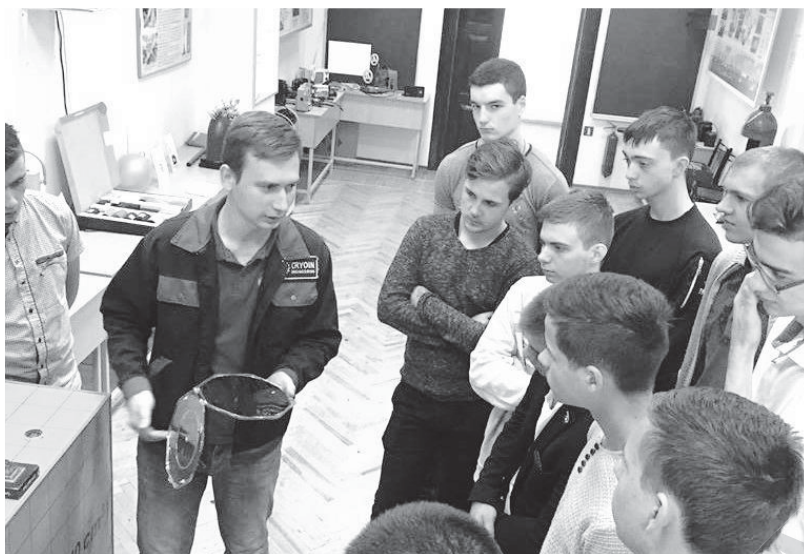
Рис. 1 – Відвідування музею-лабораторії кріогенної техніки

Вони були свідками цікавих дослідів, які наочно демонстрували природні явища і низькотемпературні процеси. Школярам були показані унікальні експерименти, пов'язані з