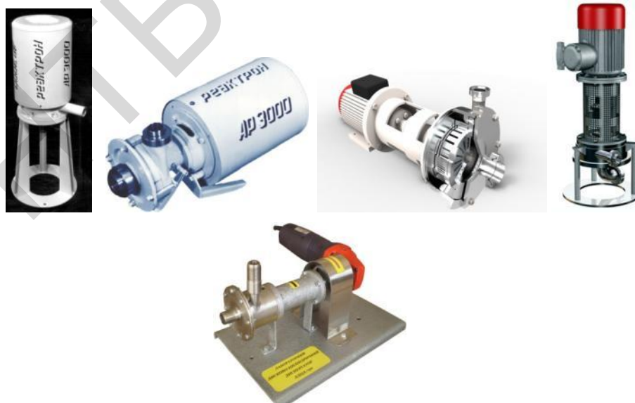
а) б) в) г) д)

Выбор модели аппарата зависит от физико-химических свойств системы и комплекса тепло- физических процессов, которые обусловлены технологическими регламентами. Осуществление технологических процессов в аппаратах реализуется за счет комплекса физических явлений: трансформация потенциальной энергии в кинетическую, механизмы сдвига и среза, кавитация, акустические колебания, микрзакипания, поляризация частиц, мгновенный локальный нагрев и другие механизмы дискретно- импульсного ввода энергий (ДИВЭ) в гетерогенные среды. Размер и продолжительность гидродинамических возмущений потока жидкости и температурные градиенты в средах, которые обрабатываются в таких аппаратах, зависит в т.ч. от технических и конструктивных характеристик аппаратов (табл. 3). Впервые благодаря внедрению аппарата АР-3000 в линию получения суппозиторных ЛФ удалось решить проблему получения стабильных дифильных систем, то есть систем с гидрофобной дисперсионной средой с равномерно распределенной в ней гидрофильной дисперсной фазой.