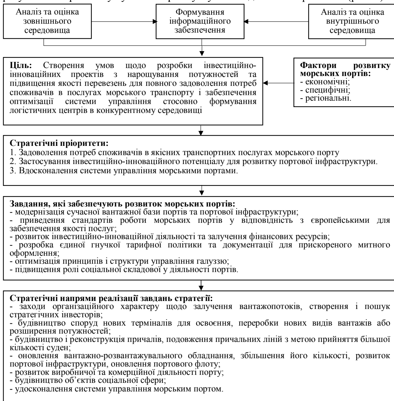
Рис. 2. Концептуальні засади стратегії розвитку морських портів Одеської області

Розроблено концептуальні засади стратегії розвитку морських портів Одеської області, особливістю яких визначено систему заходів, направлену на задоволення потреб споживачів в якісних транспортних послугах, ефективне використання і підвищення портових потужностей на інноваційній основі, забезпечення оптимізації системи управління стосовно формування логістичних центрів, вирішення соціальних проблем при врахуванні регіональних особливостей, економічних інтересів держави та регіону для регулювання розвитку сучасного ринку мультимодальних перевезень (рис. 2).