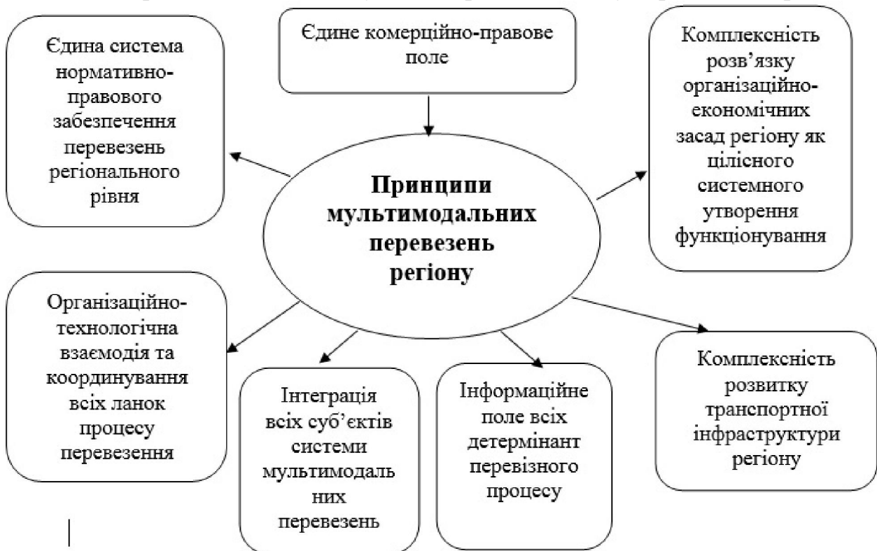
Рис. 1. Принципи функціонування мультимодальної системи перевезення вантажу на регіональному рівні

Запропоновано основні принципи функціонування мультимодальної системи перевезення вантажу на регіональному рівні (рис. 1.).