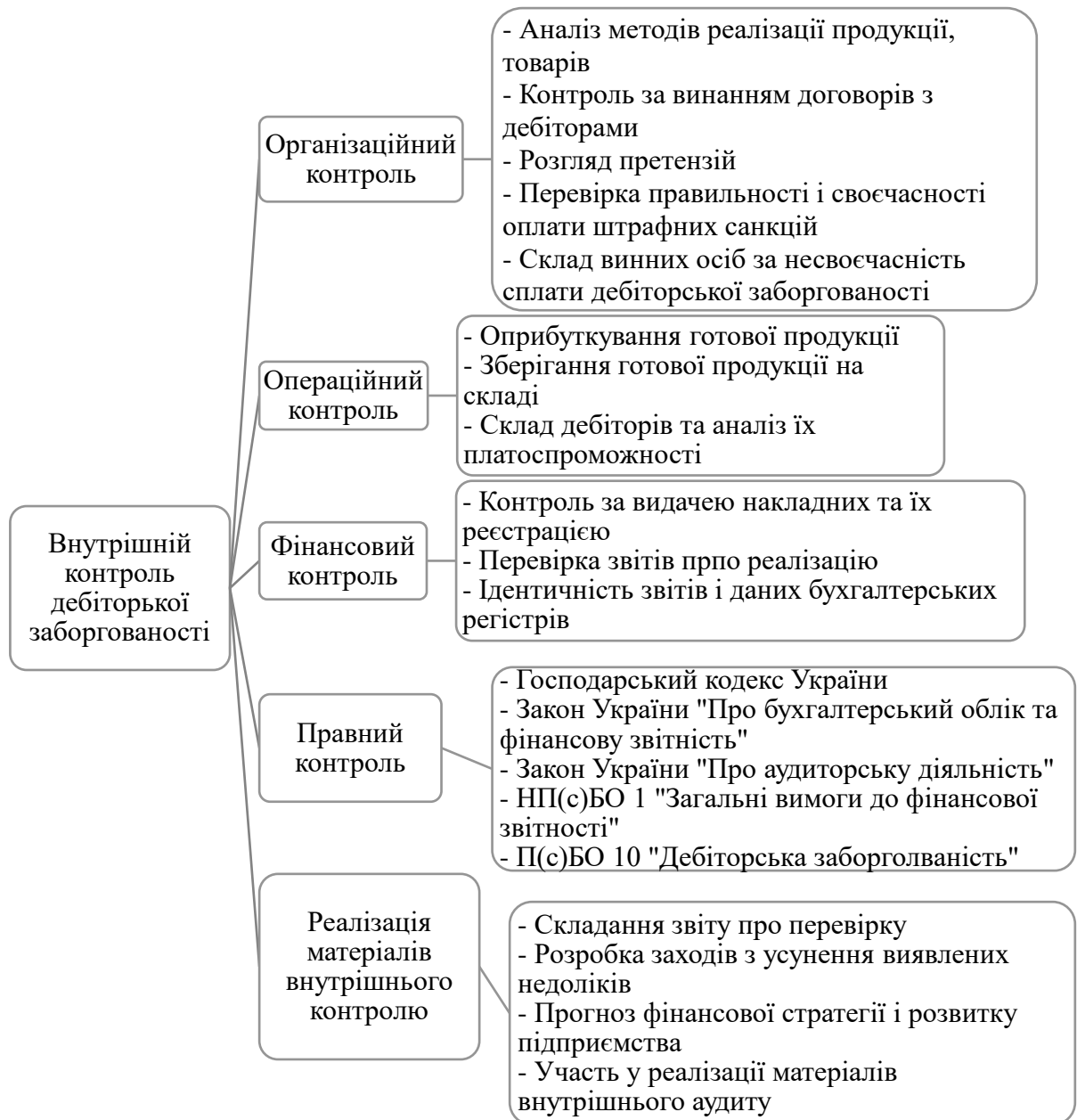
Рис. 3.3. Модель внутрішнього контролю дебіторської заборгованості [6]