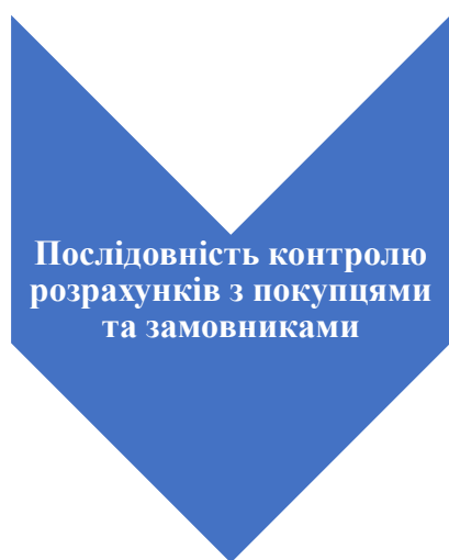
Рис. 3.2. Послідовність контролю розрахунків з покупцями та замовниками*

Готовий до передання товар повинен бути відповідним чином ідентифікований для цілей цього договору, зокрема шляхом маркування. Якщо з договору купівлі-продажу не випливає обов'язок продавця передати товар покупцеві, доставити товар або передати товар у його місцезнаходження, то він вважається виконаним у момент здачі товару перевізникові або організації зв'язку для доставки покупцеві.