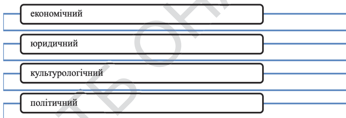
Рис.1 – Основні елементи зовнішнього середовища (систематизовано авторами на підставі [1,2])

Зовнішньоекономічна діяльність завжди була і буде складовою суспільного розвитку країн, незважаючи на зміни в політичній ситуації, економічній кон'юнктурі та правовому середовищі. Середовище компаній, які діють на міжнародному рівні, відрізняється підвищеною складністю. При виході на міжнародні ринки потрібно враховувати відмінності в законах, традиціях, культурі, політичній стабільності, законодавстві, технічному розвитку та інше [1]. Основні елементи зовнішнього середовища можна представити такими блоками (Рис.1)