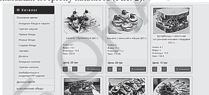
Рис. 2 – Каталог страв

Поруч з «Особистим кабінетом» знаходиться «Кошик», що відображає кількість доданих страв, повну суму замовлення, а також максимальну кількість кілокалорій страв. Крім того, є можливість одразу «Оформити замовлення» або «Перейти до кошика» для зміни кількості страв і оформлення замовлення звідти. У розділі «Каталог» розміщено меню і підменю, за допомогою яких користувач може вибрати страви, додавши їх до кошика і вказавши потрібну кількість (Рис. 2).