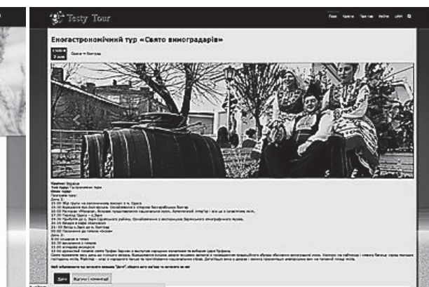
Рис.2. Еногастрономічний тур «Свято виноградарів»

Загалом, треба відмітити, що тема створення WEB-сайту туристичної компанії є досить актуальною у наш час, саме тому й була обрана для дослідження та практичної реалізації в даній роботі.