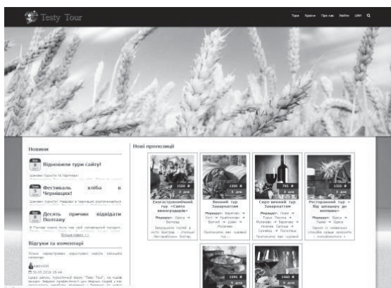
Рис.1. Головна сторінка сайту