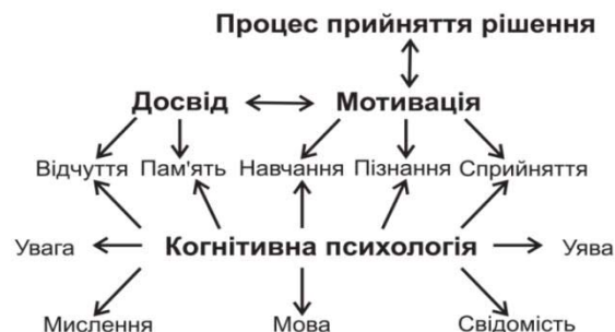
Рис.1 – Когнітивно-психічні процеси, що впливають на дії особистості під час прийняття рішення

Нами була розроблена схема зв'язку когнітивно-психічних процесів з процесом прийняття рішення в туризмі (рис. 1).