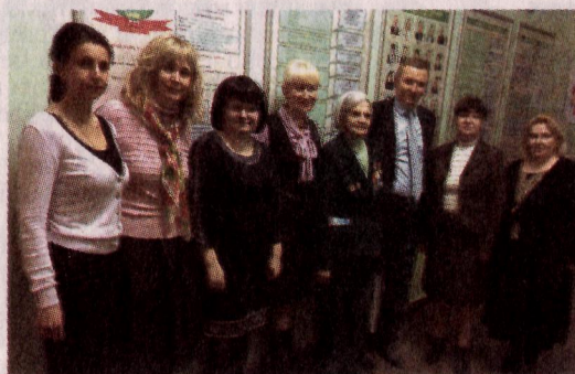
ПРЕПОДАВАТЕЛЬСКИЙ СОСТАВ КАФЕДРЫ «УЧЕТ И АУДИТ», ПО ЦЕНТРУ УЧАСТНИЦА ТРУДОВОГО ФРОНТА В Ф. ПАХТУСОВА

В завершение было отмечено, что война, пришедшая в каждый дом, в каждую семью, разбудила благородную ярость души, объединила и подняла огромную силу, которая разгромила нацистские орды.