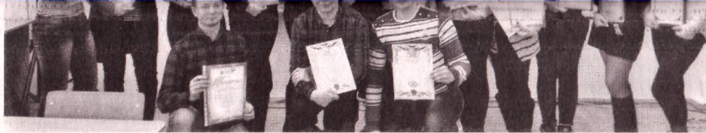
КРАЩІ СТАРОСТИ ГРУП, ПЕРЕМОЖЦІ ОЛІМПІАД, АКТИВ СТУДЕНТСЬКОЇ РАДИ (СПЕЦІАЛЬНІСТЬ «ОБЛІК ТА АУДИТ»)

раших не потрапив. Окрім того завдяки таким зустрічам наші студенти мають можливість поспілкуватися з роботодавцями і навіть отримати цікаві пропозиції за економічними спеціальностями.