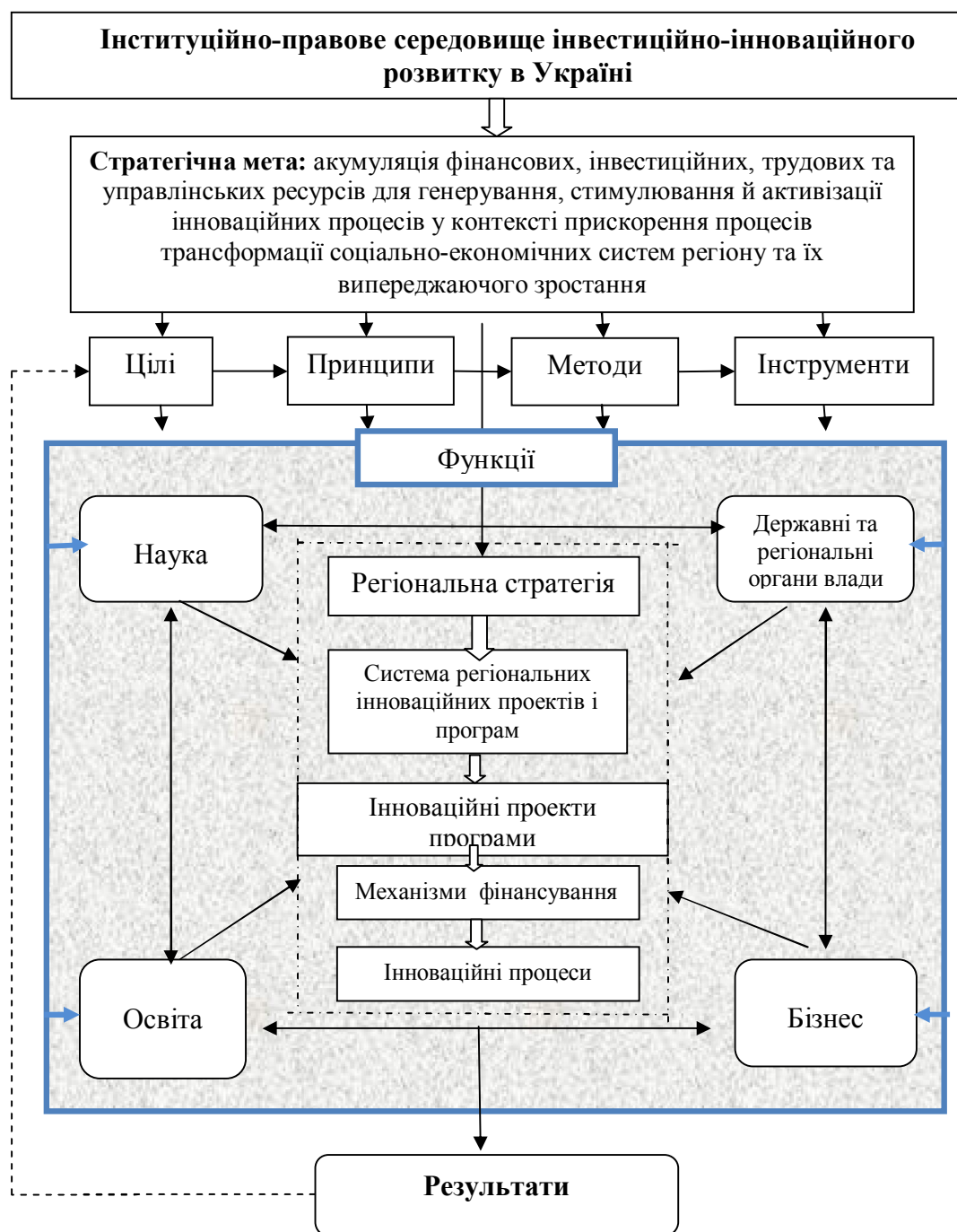
Рис. 3. Функціональна модель організації інвестиційно-інноваційних процесів регіону на засадах державно-приватного партнерства

Варто визнати, що наразі процес побудови ефективної взаємодії між владою, бізнесом, освітою і наукою на засадах державно-приватного партнерства перебуває у зародковому стані, що зумовлює актуальність науково-практичного пошуку в цьому напрямку та розроблення ефективних моделей такої співпраці, зокрема на регіональному рівні. Запропонована автором системна функціональна управління інвестиційно-інноваційними процесами складається з таких елементів: суб'єкти, функції, цілі та принципи, методи та інструменти регулювання (рис. 3).