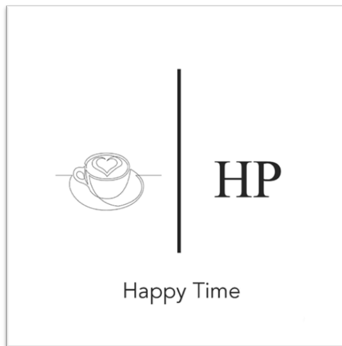
Рис. 2.1.2 Логотип кав'ярні «Happy Time»

Для початку ми повинні розробити логотип кав'ярні, що ми можемо зробити самостійно. Саме цей логотип буде майорити на націй вивісці (рис. 2.1.2).