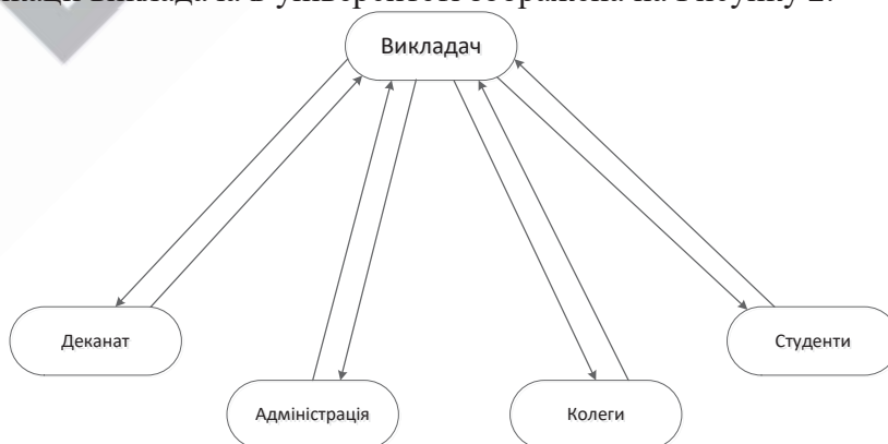
Рисунок 2 – Схема комунікації викладача в університеті