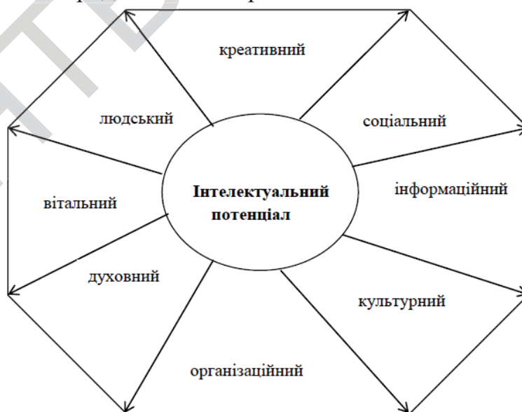
Рис. 1. Основні види інтелектуального потенціалу в процесі перетворення у інтелектуальний капітал

Слід відзначити, що інтелектуальні ресурси на відміну від виробничих ресурсів майже необмежені, тобто немає найважливішої проблеми сучасності – ресурсного обмеження соціально-економічного розвитку як суб'єктів виробничої діяльності, так і держави в цілому. Можна виділити велику кількість складових інтелектуального потенціалу, реалізація яких перетворює їх на інтелектуальний капітал, основні з них представлені на рис. 1.