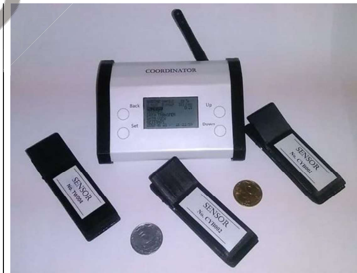
Рис. 3. Дослідний взірець бездротової сенсорної мережі

При вивченні ІФХ поширеним методом є застосування параметрів кривої ІФХ, як то F_0 , F_p , F_s , та їхніх відношень. Найпоширенішим є відношення F_v/F_m . В літературі проводяться