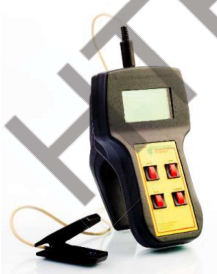
Рис. 2. Прилад сімейства «Флоратест»