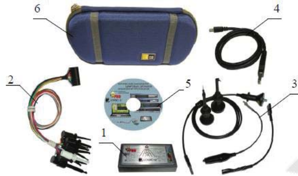
Figure 1. Set of the device "LOGIK-U PRO"

An example of this device on the Ukrainian market can be development of the signal analyzer "LOGIC-U PRO". The instrument kit includes an analyzer box, a cable with replaceable tips and an external separator, software and operating instructions.