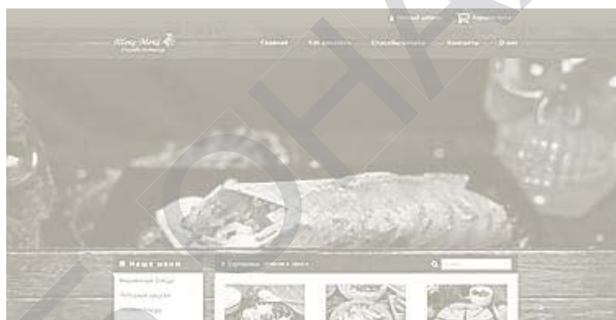
Рис. 1 – Головна сторінка сайту

На Рис.1 можна побачити головну сторінку сайту. На ній зверху розташовані вкладки «Особистий кабінет» і «Кошик». В «Особистому кабінеті» при реєстрації користувач вказує інформацію про себе, має можливість переглянути всі оформлені замовлення, переглянути власну знижку, яка нараховується за правилами системи, а також змінити пароль.