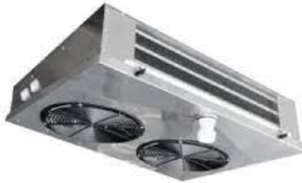
Рис. 2.5 Повітряохолоджувач фірми Tehma TCM-2177E