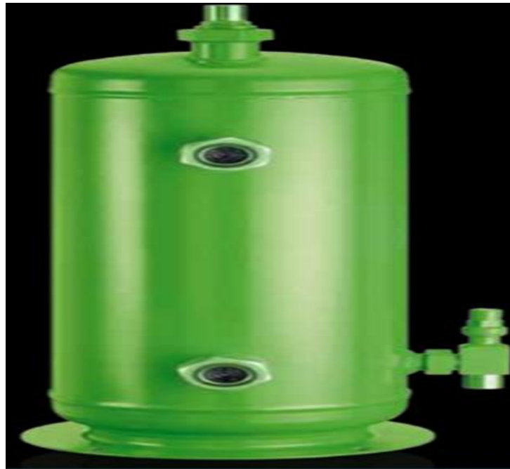
Рис. 2.6 Ресивер фірми Bitzer марки F392T с V = 39 \text{ дм}^3

Приймаємо ресивер фірми Bitzer марки F392T с V = 39 \text{ дм}^3