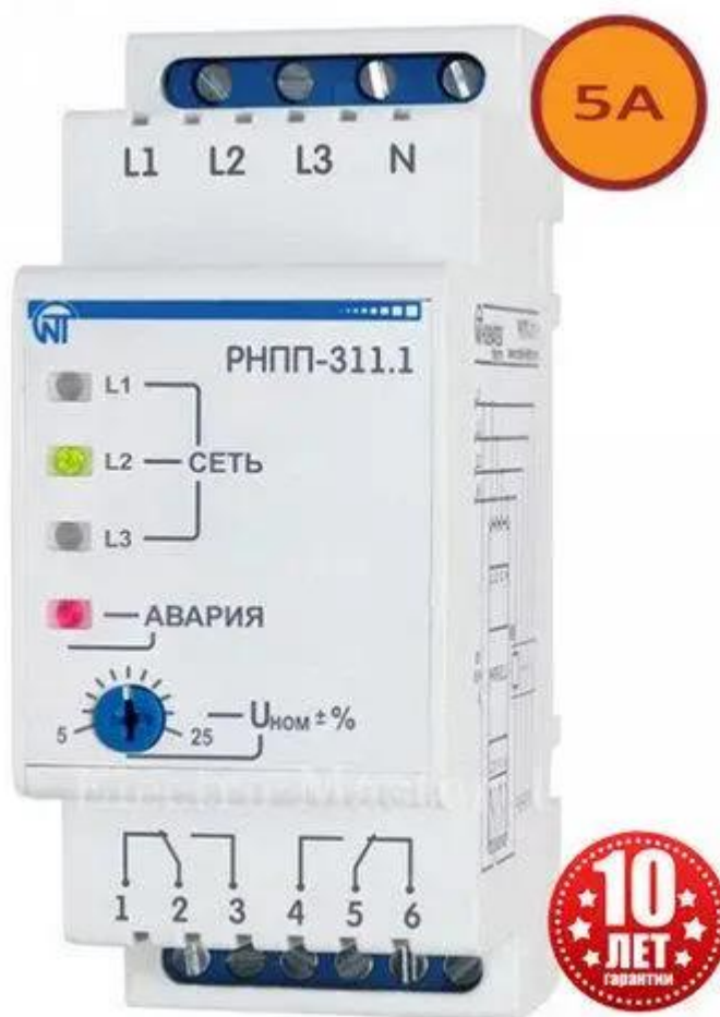
Рис. 3.3 Трифазне реле напруги, перекосу та послідовності фаз РНПП-311.

Трифазне реле напруги, перекосу та послідовності фаз РНПП-311 призначене: Для контролю допустимого рівня напруги; Для контролю правильного чергування та відсутності злипання фаз; Для контролю повнофазності та симетричності напруги мережі (перекосу фаз); Для відключення навантаження при неякісній напрузі; Для контролю якості напруги мережі після відключення навантаження та автоматичного включення її після відновлення параметрів напруги; Для індикації аварії при виникненні аварійної ситуації та індикації наявності напруги на кожній фазі. У виробі передбачено можливості регулювання параметрів (порога спрацьовування за напругою, часу АПВ та часу затримки спрацьовування захисту), вибору напруги контрольованої мережі (400 В або 415 В) та набору захисних функцій.