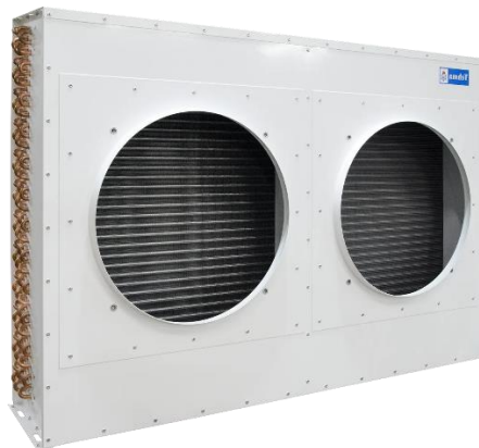
Рис. 2.3 Конденсатор фірми Tehma ТМС-32

Приймаємо повітряний конденсатор фірми Tehma ТМС-32 з F = 75,8 \text{ м}^2