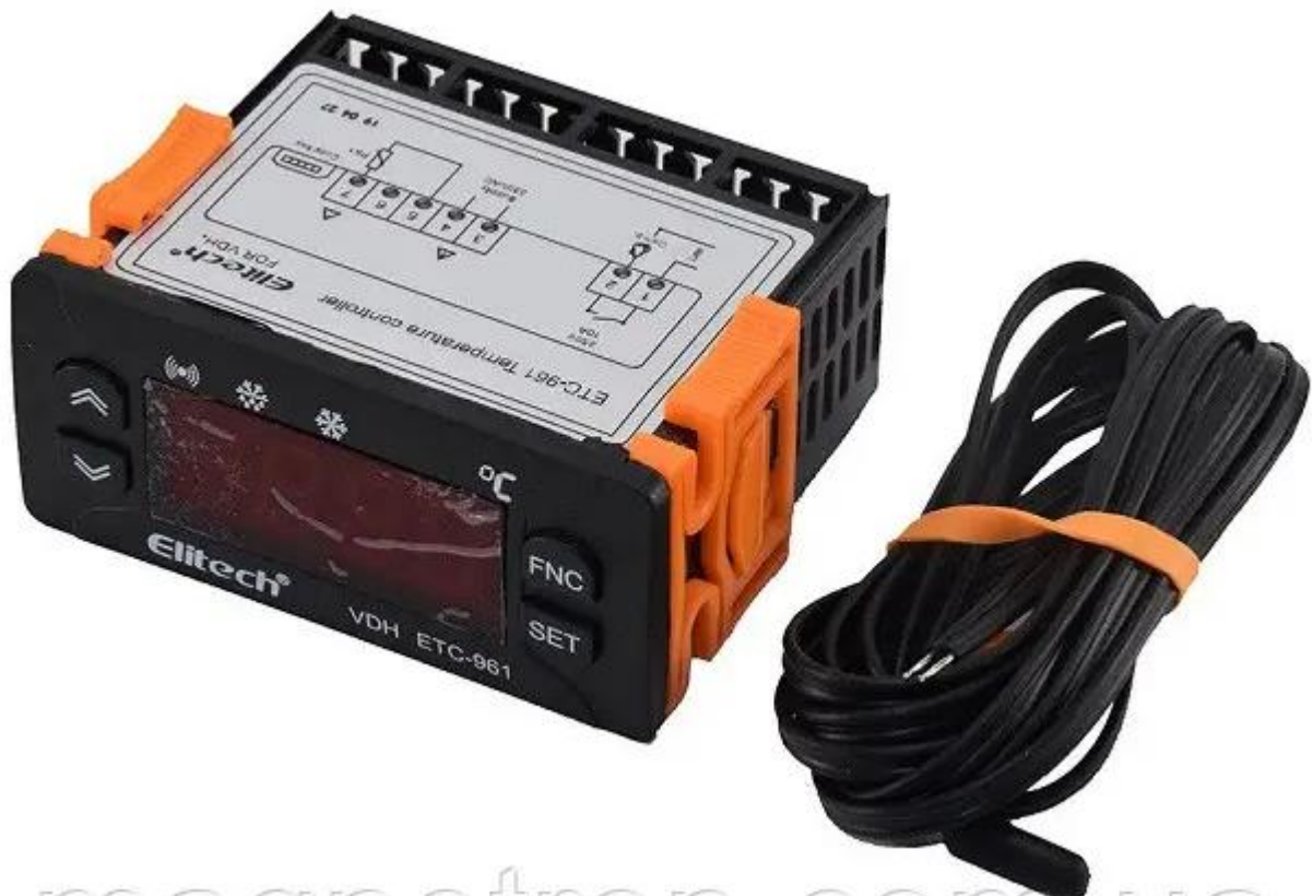
Рис. 3.4 Контроллер ETC-961

Контролер ETC-961 відноситься до серії базових ступінчастих контролерів для холодильного обладнання. Випускається в стандартному корпусі 74x32мм, кріпиться в панель спеціальними кліпсами. Передня панель має захист IP65, 3 робочі кнопки. Дані температури виводяться на LED-дисплей у вигляді двозначного числа, зі знаком мінус, індикатори стану представлені кольоровими іконками.