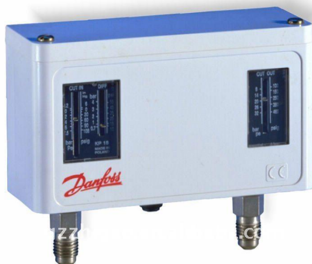
Рис. 3.6 Реле тиску КР 15.