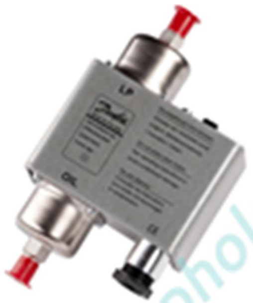
Рис. 3.2 Реле тиску типу MP 54.

Реле тиску типу MP використовуються, як прилади автоматичного захисту холодильних компресорів від перепаду тиску масла. Якщо тиск масла падає, реле перепаду тиску масла зупиняє компресор через певний проміжок часу.