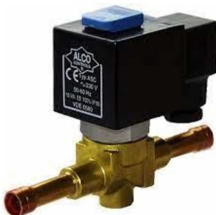
Рис. 3.5 Соленоїдний вентиль СВ 200 RB 3Т3 фірми ALCO Роботою вентиляторів конденсаторів управляє реле тиску типу КР 15.

контакти, в колі обмотки соленоїдного вентиля подача напруги на катушку СВ зупиняється, магнітне поле зникає, шток опускається та закриває соленоїдний вентиль.