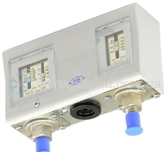
Рис. 3.1 Реле тиску ALCO PS2-A7A

- від високого тиску нагнітання низького тиску всмоктування - реле тиску ALCO PS2-A7A зупинить компресор;