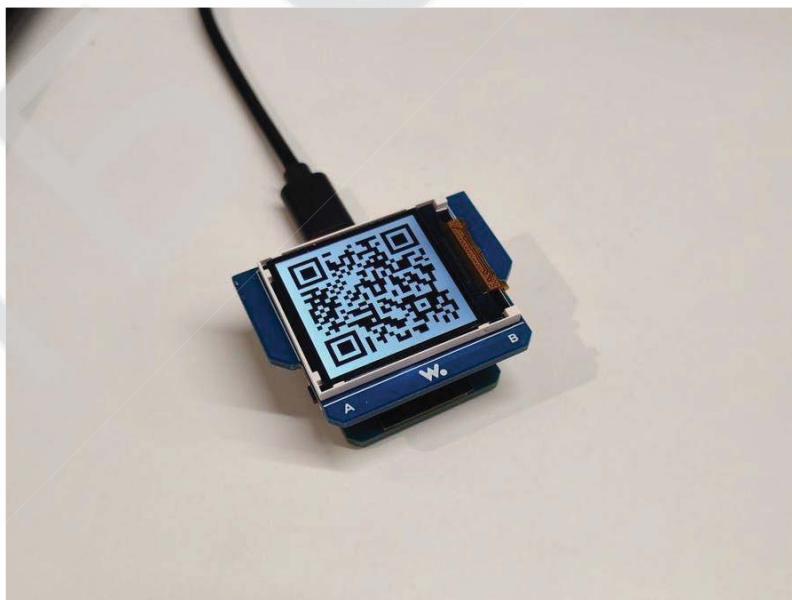
Рис. 2. Демонстрація способу відображення QR-коду за допомогою LCD дисплея

Також, окремо буде розглянуто спосіб створення засобів графічного безконтактного безготівкового розрахунку на базі мікроконтролерів серії STM32. На рисунку 2 висвітлено зовнішній вигляд QR-коду, відображеного на LCD дисплеї за допомогою описаного методу.