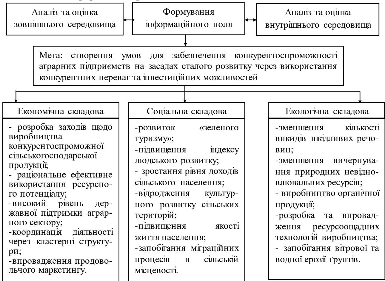
Рис. 3. Концептуальні засади стратегії конкурентоспроможності аграрних підприємств в умовах сталого розвитку

інвестиційного забезпечення сільського господарства; освоєння технологій органічного виробництва; пільгове кредитування сільського господарства; забезпечення стабільності внутрішнього ринку; регулювання цінової політики на сільськогосподарську продукцію); механізму регулювання економічної складової сталого розвитку (забезпечення конкурентоспроможності сільськогосподарської продукції; збалансоване використання конкурентних переваг сільського господарства; розвиток інвестиційно-інноваційної політики; розвиток аграрного ринку і його інфраструктури); соціальної складової сталого розвитку (забезпечення добробуту і якості життя населення; зниження рівня безробіття населення; зростання рівня доходів і обсягу споживання продукції населення); екологічної складової сталого розвитку (екологізація сільськогосподарського землекористування; використання ресурсозберігаючих технологій; забезпечення виробництва екологічно чистої сільськогосподарської продукції), що сприятиме впровадженню дій щодо зростання конкурентних можливостей аграрних підприємств.