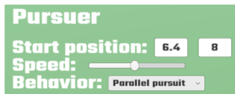
Рис 2. Користувацький інтерфейс для зміни вхідних параметрів

Безпосередньо перед початком моделювання, користувач має можливість задати вхідні параметри для кожного з об'єктів, а саме: початкову позицію (координати x та y ), швидкість (від 0.1 до 2), керування (рис. 2).