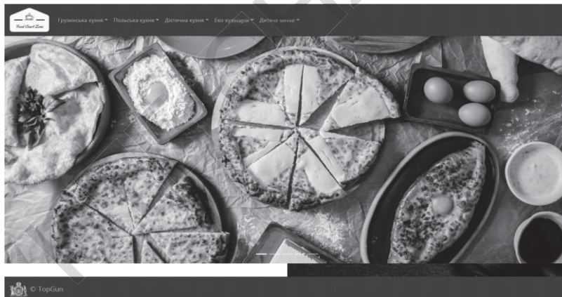
Рис. 1- Головна сторінка сайту

На рисунку 1 зображений вигляд головної сторінки створеного сайту. У верхній частині сайту можна побачити логотип обговорюваного закладу, а також перелік усіх типів меню для зручного та швидкого переходу до того типу меню страв, який подобається відвідувачу.