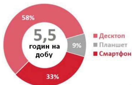
Рис. 2 - Питому вагу пристроїв, які використовуються для роботи в мережі Інтернет

На рис.2 відображено питому вагу пристроїв, які використовуються для роботи в мережі Інтернет