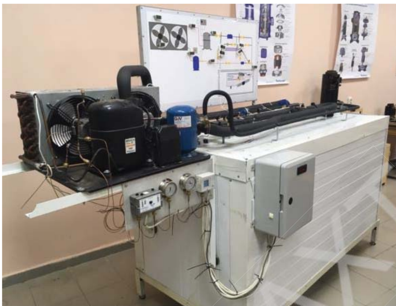
Рис.1 – Загальний вигляд експериментального стенду

Стенд обладнаний контрольно-вимірювальними приладами для проведення експерименту. Машина працює за циклом одноступеневого стиснення, робоча речовина – R507. Теплове навантаження в камері забезпечується електронагрівачем з регулюванням потужності.