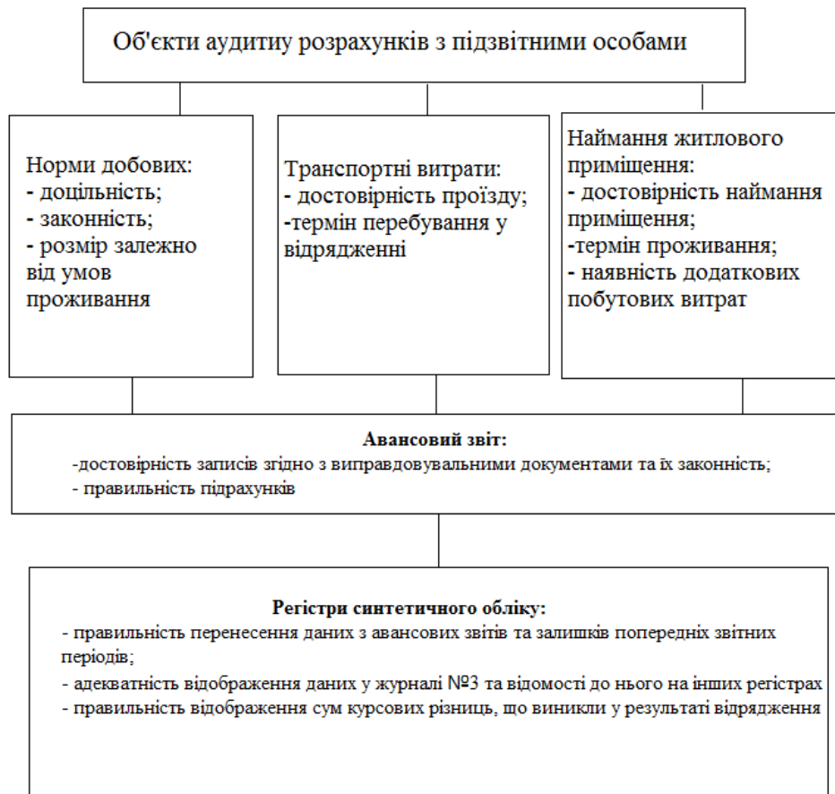
Рис. 1.3 – Об'єкти аудиту розрахунків з підзвітними особами [23]

Процес проведення аудиторської перевірки розрахунків з підзвітними особами має свою певну послідовність, тобто складається з окремих послідовних етапів, які наведені на рис. 1.4.