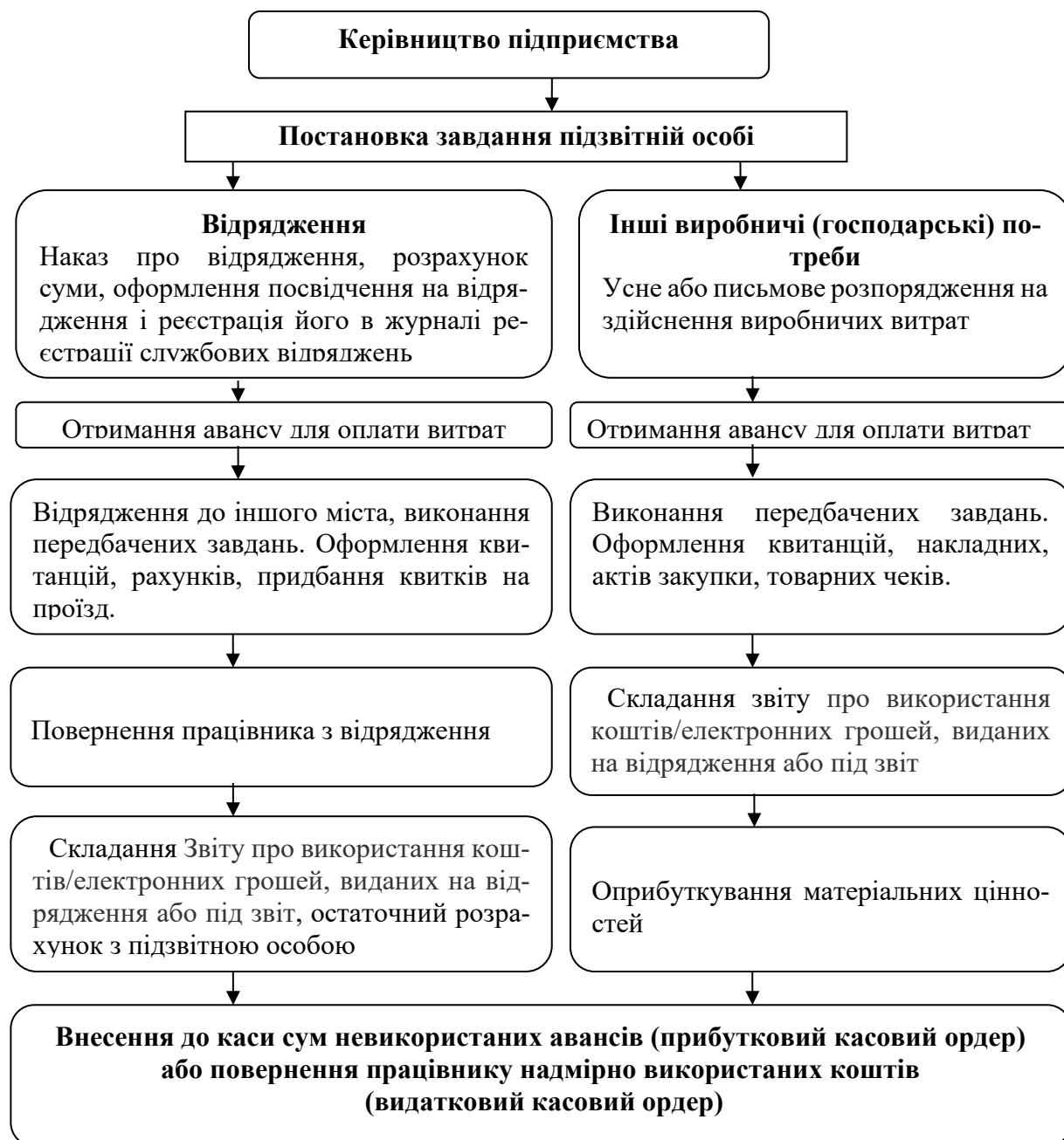
Рис. 1.2 – Схематичне відображення документального оформлення обліку розрахунків з підзвітними особами [28]

Схематичне відображення документального оформлення обліку розрахунків з підзвітними особами наведено на рис. 1.2.