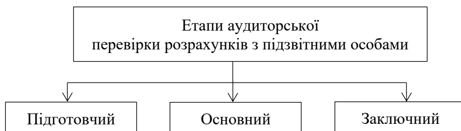
Рис.1.4 – Етапи проведення аудиторської перевірки розрахунків з підзвітними особами*

Процес проведення аудиторської перевірки розрахунків з підзвітними особами має свою певну послідовність, тобто складається з окремих послідовних етапів, які наведені на рис. 1.4.