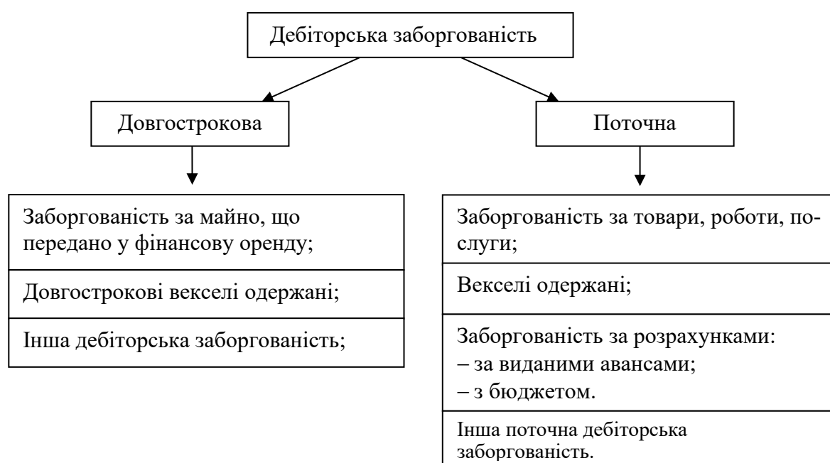
Рис.1.1 – Класифікація дебіторської заборгованості за НПСБО1»Загальні вимоги до фінансової звітності» [9, 15]

Класифікація дебіторської заборгованості в залежності від термінів її погашення наведена на рис.1.1.