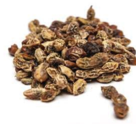
Рис. 3 – Зрілі висушені плоди софори японської