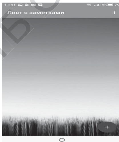
Рис.2 – Лист з замітками

Якщо у користувача є бажання багато чого досягти, багато встигнути, тоді саме цей програмний продукт буде в нагоді, основне завдання планування він візьме на себе, і буде важливою сходинкою в досягненні поставлених цілей і якості використання свого часу.