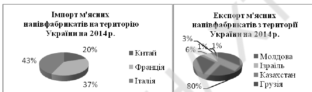
Рис. 2 – Імпорт та експорт м'ясних напівфабрикатів

На українському ринку готових заморожених напівфабрикатів працює ряд великих національних підприємств і значна кількість регіональних операторів.