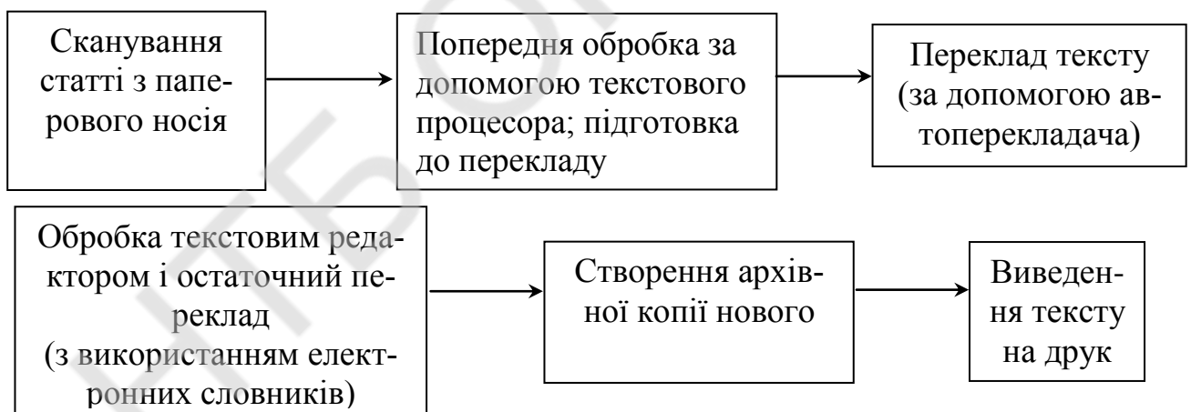
Рис. 1. Схема роботи зі статтею у зарубіжному журналі іноземною мовою

До ери поширення персональних комп'ютерів (ПК) комп'ютерний переклад міг був більше цікавим об'єктом наукових досліджень, чим важливою сферою дослідження обчислювальної техніки. На то було дві значні причини: 1) велика вартість часу роботи ЕОМ (з огляду на той факт, що кожен обчислювальну машину обслуговувала велика група системних програмістів, інженерів, техніків і операторів, кожній машині було потрібне окреме, спеціально обладнане приміщення і т.п., "комп'ютерний час" був дуже і дуже дорогим); 2) колективне користування ресурсами комп'ютера. Остання обставина часто не дозволяла негайно звернутися до електронного помічника, зводячи на ніщо найважливішу перевагу машинного перекладу перед звичайним – його оперативність. Саме поява ПК стала сильним додатковим стимулом для вдосконалювання комп'ютерного перекладу (особливо після створення комп'ютерів Apple II у 1977 р. і IBM PC у 1981 р.). Застосування комп'ютерних технологій допомагає будь-якому фахівцю одержати необхідну інформацію із зарубіжних джерел за схемою, яка наведена на Рис. 1.