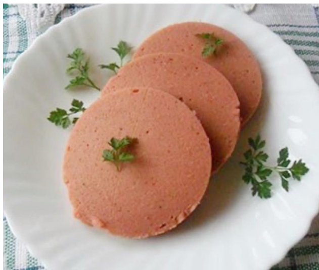
Рис. 2.5. Зовнішній вигляд ковбаси сейтанової

Органолептичні показники. Вегетаріанська ковбаса сейтанова характеризується високими смаковими якостями, пружною консистенцією і була без сторонніх запахів. Батони на розрізі були від рожевого до світло-рожевого кольору з рівномірно перемішаним фаршем без сірих плям і порожнин.