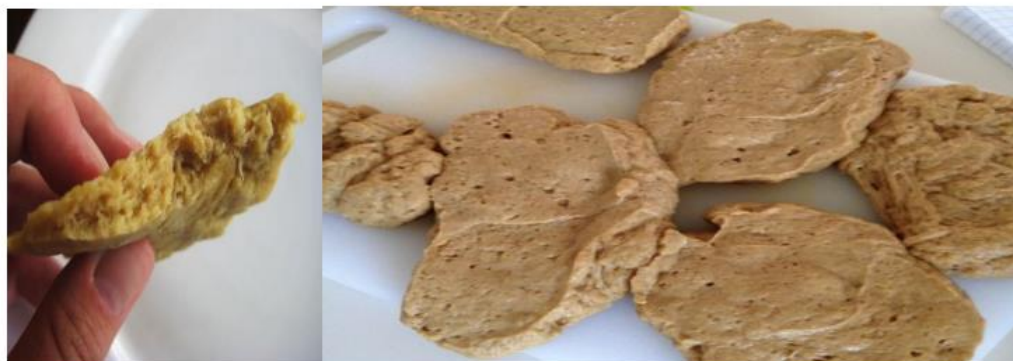
Рис. 2.2 Зображення заготовки сейтанового продукту

смаженню та вегетаріанського виду ковбаси. Оцінка готового продукту проводилася за органолептичними показниками якості, за загальноприйнятими методиками.