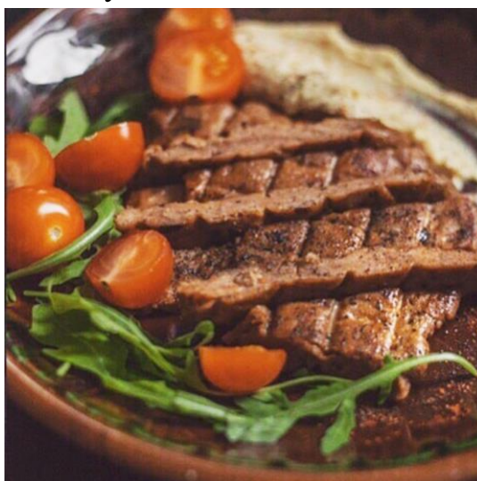
Рис. 2.2 Зображення страви Стейк Сейтан

Отриманий зразок страви характеризується високим вмістом білків на рівні 62 %, та помірним вмістом вуглеводної та ліпідної складових.