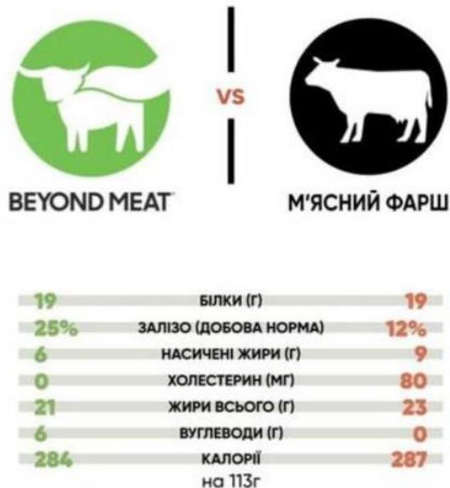
Рис 2.1. Порівняльні характеристики рослинного та тваринного м'яса

Технологія виготовлення сейтанових напівфабрикатів складається з трьох етапів.