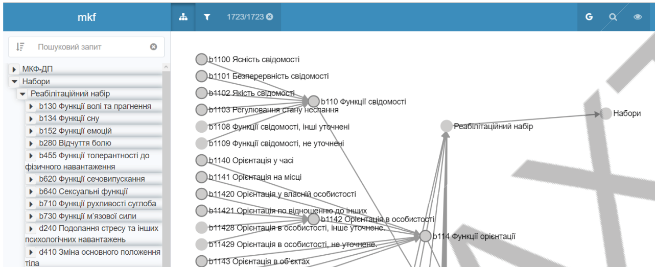
Рисунок 2. Онтологічне представлення МКФ

Керуючі онтології, на відміну від інформаційних, створюються експертами предметної галузі шляхом аналізу функцій і обов'язків, покладених на користувачів (спеціалістів-реабілітологів). Такі онтології визначають послідовність кроків, що повинен виконати спеціаліст на всіх етапах певного процесу. Важливою особливістю даного підходу є розподіл обов'язків між розробниками системи і експертами предметної галузі – можливість останніх ефективно і оперативно реагувати на важливі зміни (законодавства, рекомендацій, методик лікування та ін.) дозволяє значно спростити процес підтримки системи в актуальному стані.