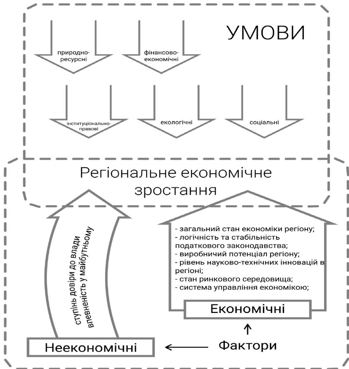
Рис. 1 Теоретичний концепт регіонального економічного зростання через призму умов та факторів

Підсумовуючи проведені дослідження вважаємо за доцільне групувати фактори за двома компонентними ознаками: економічні та неекономічні, причому перелік факторів не може бути усталеним, а повинен постійно переглядатися відповідно до сучасної ситуації.