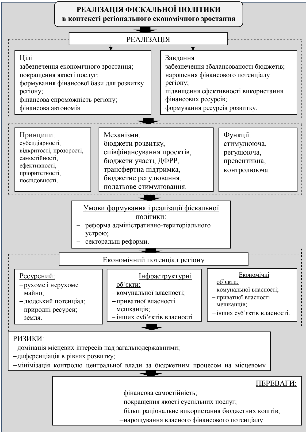
Рис. 2 Модель реалізації фінансової політики в контексті регіонального економічного зростання